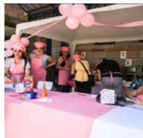
4° A - 4°B Churrasco/Chacarero