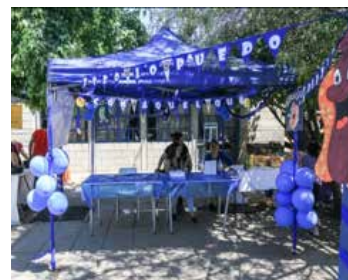
3ER LUGAR 3° A- 3°B Choripanes

FELICITACIONES A TODOS NUESTROS PARTICIPANTES EN EL