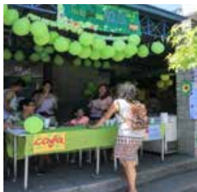
2° LUGARES K° A- K°B Helados light