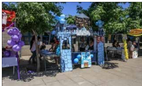
1ER LUGAR 1°A - 1°B Mote con huesillo