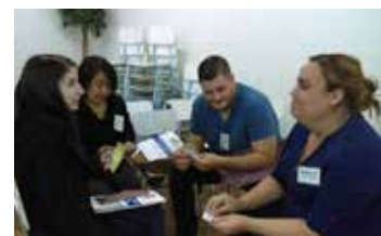
2° Básico apoderados compartiendo en grupo.

Recuerda acércate: Personalmente, o por teléfono al 22 870 05 48, o por mail a: epp@colegiosanlorenzo.org