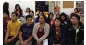
Sesión padre hijos 7° Básico

Prontamente comenzaremos el taller de 2° Básico (viernes 29 de mayo de 9:00 a 11:00 hrs.) ¡Quedan inscripciones para los distintos talleres, los esperamos a la brevedad posible... no dejen para mañana lo que pueden hacer hoy!