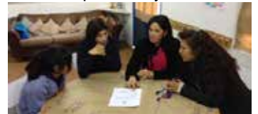
Sesión padre hijos 6° Básico

Acérquese personalmente o llámenos al 228700548 (EPP) o al 228700537 (Asistente Familia) o Mándenos un correo a: epp@colegiosanlorenzo.org